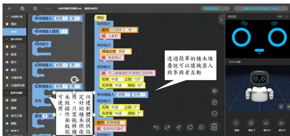
圖 2、機器人程式積木介紹

首先，預計於營隊前期的情緒課程使用的教育比機器人作為主要教學工具，透過師資生操作機器人帶領課程，使身心障礙學生對於機器人可運用之型態有基本認識與了解；其次利用學習策略與鷹架，提供詳細的步驟圖示（step by step）與重複的練習，以增進其實作理解及執行的成功經驗；最後期待學生能運用所學之程是編輯能力與師資生共創出身心障礙學生的介紹與這三天在營隊中自身的情緒轉變與過程處理等。