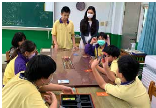
▲桌遊融入社會技巧課程，引導學生輪流擔任主持人，並練習尊重及聆聽每個人不同的想法。