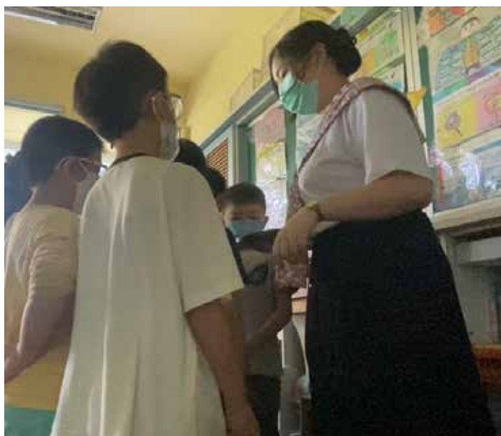
▲請學生思考道歉和改進方法

雖然各式各樣的問題還是會不斷浮現，但能協助孩子們認知問題所在、找到解決方法，我想期初時的那個疑問缺口應該會在教學的過程中持續被填補上，而我也能逐步摸清並掌握屬於我的班級經營風格。