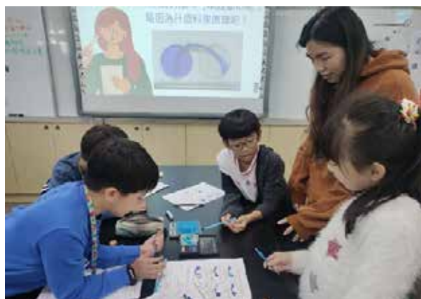
▲動手實驗，觀察、思考、找答案

透過觀摩夢想老師的課程以及實際引導學生後，我對於專題與獨立研究的引導方式有了不一樣的想法。過去我印象中的學習歷程，總是大人叫我們做什麼，我們就做什麼，有不會的問題，也是習慣性的用詢問的方式找到答案，因此，我一直很好奇，身為一位「大人」，我們該如何引導學生完成專題與獨立研究，看到老師帶領學生的方式後，我覺得我的想法改變了，老師並不是用「自己的想法」去引導，而是尊重學生的想法，協助他們前往自己想要前進的方向。回想一開始，我常常會忍不住詢問老師，這樣可以嗎？感覺好像不會成功耶，想進一步的了解老師接下來會如何「引導」學生，但老師總會跟我說，