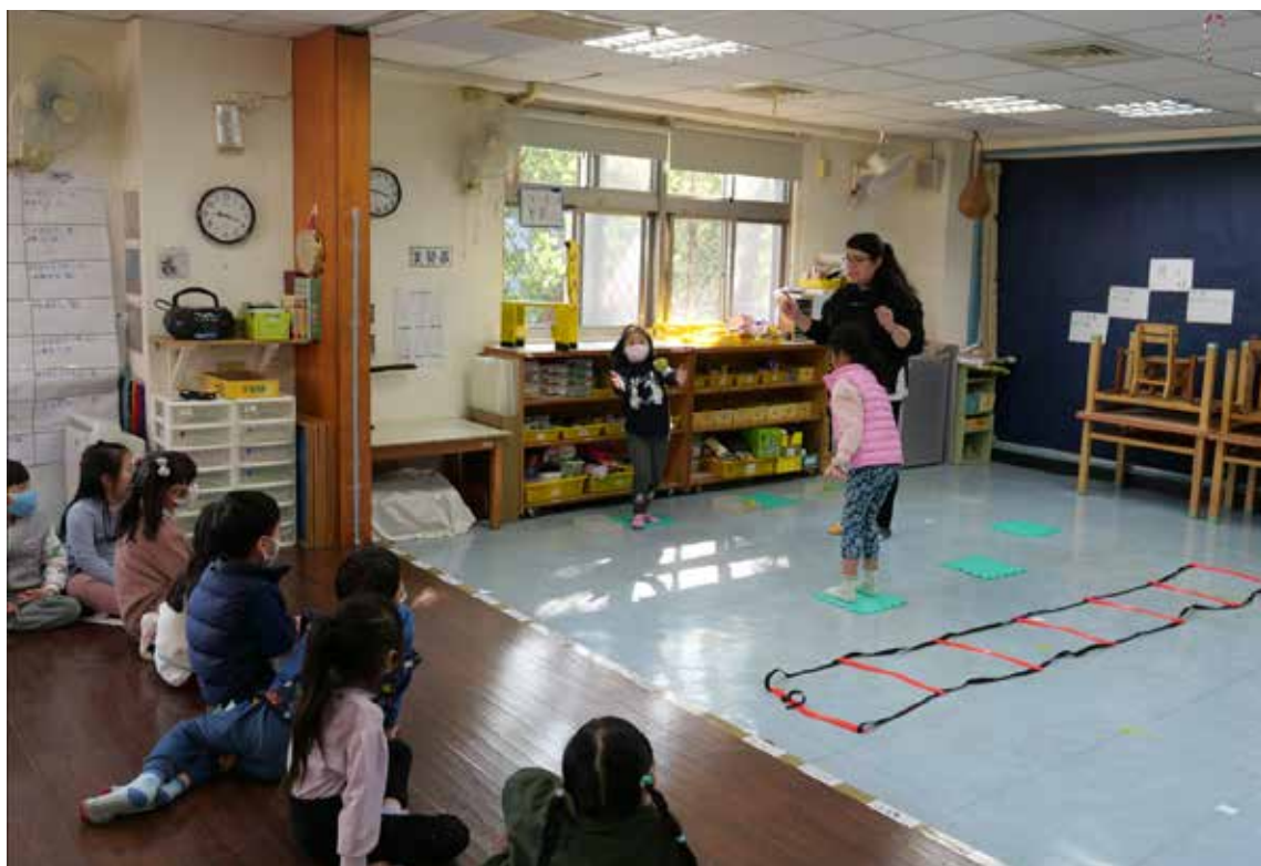
設計循環式體能，讓孩子有機會發展體能強項、補足弱項

以！」，孩子好奇的問我：「為什麼你覺得我可以做到？」，我回答：「因為曾經的我也是這麼相信我自己的，而現在的我正努力的實現著。」，懵懂的她傻笑著，我不知道她有沒有聽懂，但希望在未來的某個時刻，我們能再次在幼教圈相遇，希望那時的我能像實習中的教授、園長、老師們一樣，將最寶貴的經驗與傳承帶給她。實習並未讓我害怕幼教，更多的是喚起我的初衷，讓我發現原來我如此的熱愛幼教，我喜歡每個彎腰貼近孩子的心；喜歡與孩子成長共舞的每一刻。半年的實習，是美好幼教的前奏曲，謝謝這段優美的曲子，讓我看見幼教的種種美好與希望，期待在未來，我也能帶著一個個可愛的音符，譜出屬於我的樂章。