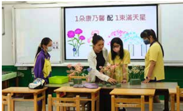
▲學課融入母親節，具體呈現學習內容並在實務操作下引導學生理解基本概念。

教育實習期間，很幸運能跟著很多現場教師學習，每位老師的風格雖不盡相同，但可以看見每位老師的熱情以及對學生的愛都是一樣的。在新民國中，滿滿都是教師間互助、合作與輔導學生的風景，許多老師是自願利用休息時間來指導學生或安排課餘活動。我深深的體悟了這句名言：「If you want to go fast, Go alone. If you want to go far, Go together.」，看著這些熱情四射的教師們認真投入地討論與規劃活動，或是盡心盡力花時間為學生個別指導；學生們也樂在其中地享受著活動，或當疑問、困難得到解決時的開朗表情，這一切讓我在心中埋下一個種子，希望自己能像這些老師一樣，成為一位能為學生搭鷹架的教學者，成為一位能讓學生享受校園生活的教師，更期許自己未來不論遇到何等挫折，也能保持著如此的初衷。