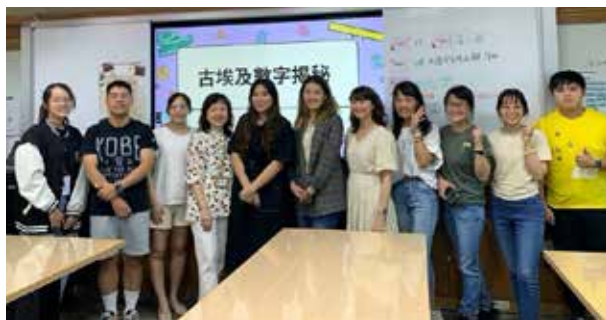
感謝教授、老師們與夥伴們的指導與陪伴

在資優班實習期間，我觀摩了幾堂 DFC 的課程，我發現老師給予學生許多講座、活動等外部資源，於是詢問老師資源都是如何取得的，老師說遇到學生想做的題目，他就會盡力找資源，很多都是透過臉書聯繫的，聯繫的過程中先自我介紹，再說明學生的動機和目的，並且肯定對方的貢獻。熱心的人很多，通常很快就收到回應，但也經常被拒絕，然而被拒絕不氣餒，再找下一個就好了。我最喜歡老師說的一段話「老師要勇敢跨出去，被拒絕就再找下一個就好了，最重要的是，幫助學生解決他們想改變的問題。」希望未來我也有足夠的勇氣，帶領學生探索世界，同時也幫助他們培養被拒絕的勇氣。