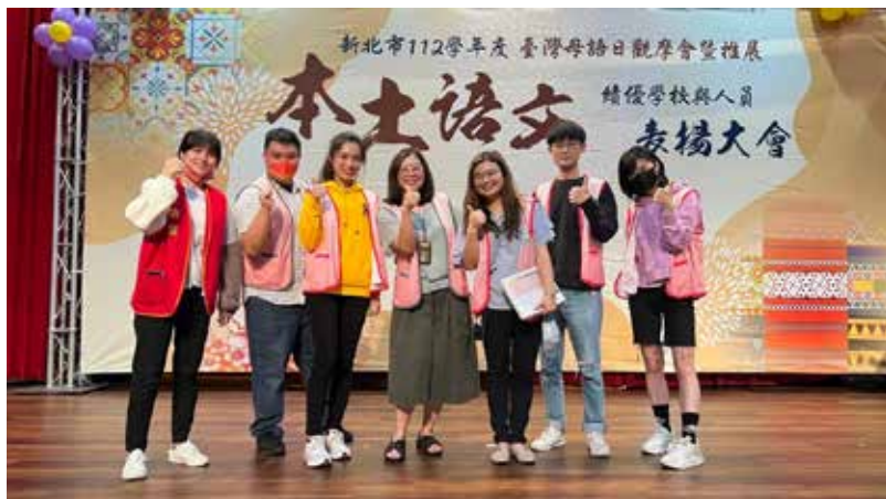
▲ 本土語文表揚大會合照