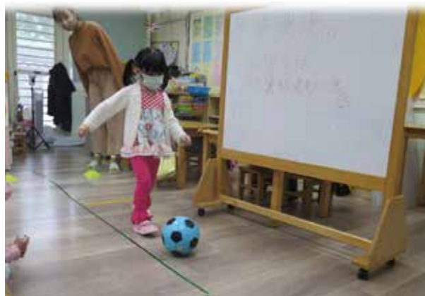
▲在「帶球散步的好方法」課堂中，邀請幼兒上台示範自己的帶球散步好方法。

很感謝這一路上輔導教師以及班級教師在實習規劃、課程教學、人際互動…等等各方面給予我許多諄諄教誨，不藏私的和我分享在教學歷程上的點點滴滴，以及每次的課程檢討都會給我大大的鼓勵，讓我有力量、有自信繼續向前，也讓我看見期初的我與期末的我，有著日就月將的進步。如同教師找尋孩子的亮點般，很幸運的，我也遇到了找到我的亮點的輔導教師，讓我也能找到自己的價值、找到屬於自己的小行星。