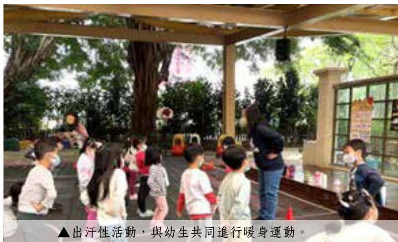
▲出汗性活動，與幼生共同進行暖身運動。

雖然這半年的實習對自己而言真的是困難重重，但我也因為受到老師的細心輔導，而讓我關關難過，也都盡力地闖關成功。學習區中的陪伴引導心急時，老師引導我看見幼生的進步，並需要肯定自己的重要性，讓我回到最初的陪伴。直至教學演示結束，我才驚覺已經到了學期尾聲了，居然已經快完成這半年實習了？！想起從一開始參加教育實習職前講習時，講師勉勵我們自己調整心態，讓自己是一張白紙的在實習中期間獲取新知、虛心求進，開始實習後忐忑的心因為有石敢當的老師讓我打消終止實習的想法，到現在我回想成就我在這一段松鼠幼兒園之峰迴路轉旅程中曾經指導過我的教授們、主任、老師們，感謝您們春風化雨的照顧，謝謝您～