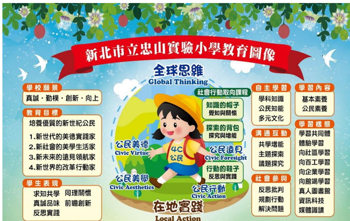
圖一、涵養學生從民主社會邁向公民社會的教育圖像