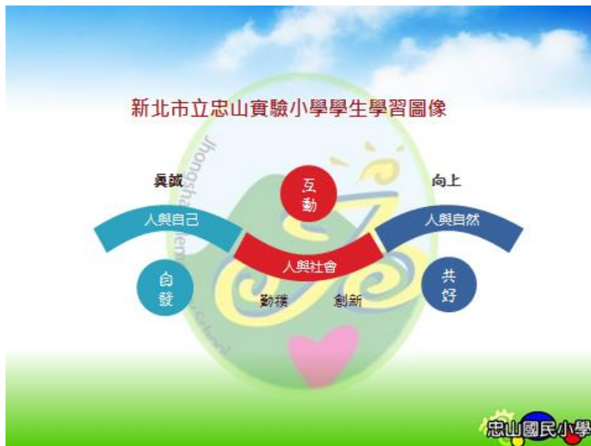
圖四、實踐學校願景的學生學習圖像